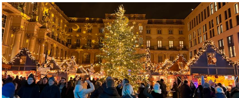
Wintermarkt Humboldt Forum